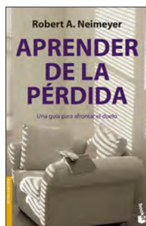
Aprender de la pérdida Neymeyer, Robert.