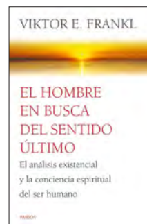
El hombre en busca del sentido último Frankl, Viktor E.